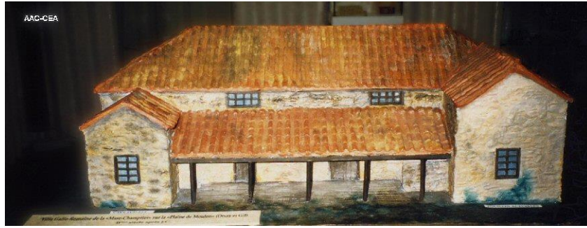
Maquette de la villa, en regardant vers l'ouest, d'après une interprétation des vestiges de la dernière phase d'occupation (3 e siècle)